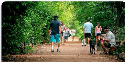
Parque Estadual do Cocó, CE