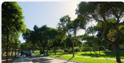
Parque Estadual Adahil Barreto, CE