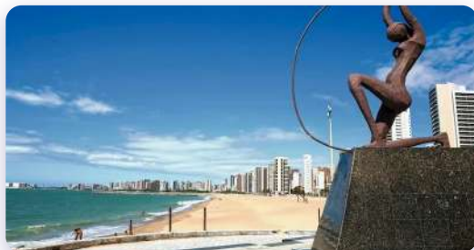
Praia de Iracema, CE