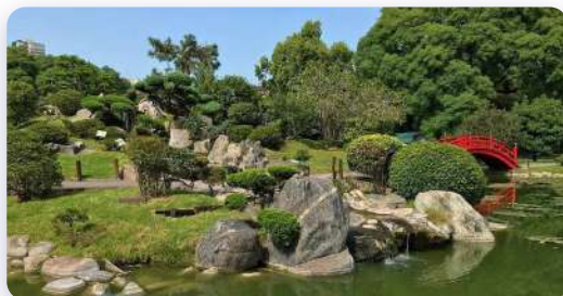
Jardim Japonês, CE