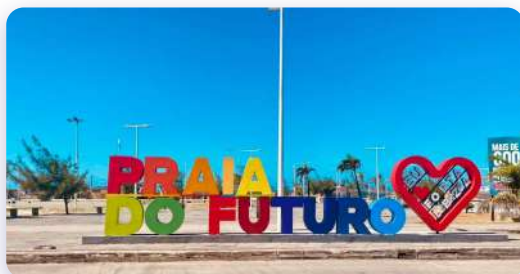
Praia do Futuro, CE