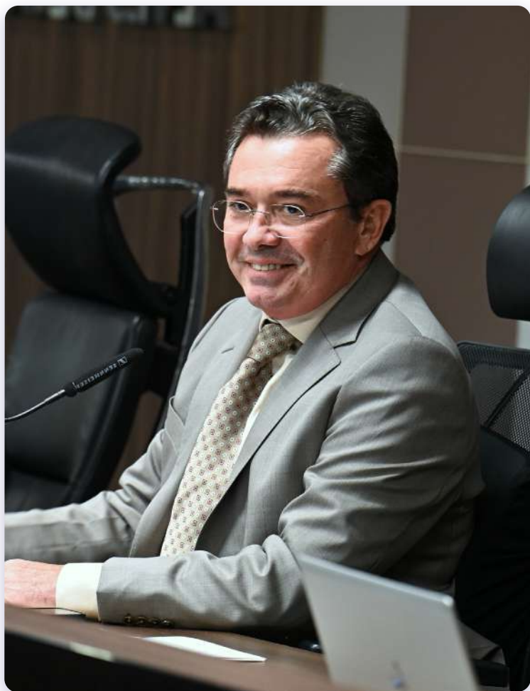
MINISTRO VITAL DO RÊGO Presidente del Tribunal de Cuentas de la Unión - Brasil