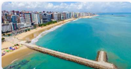
Praia do Meireles, CE